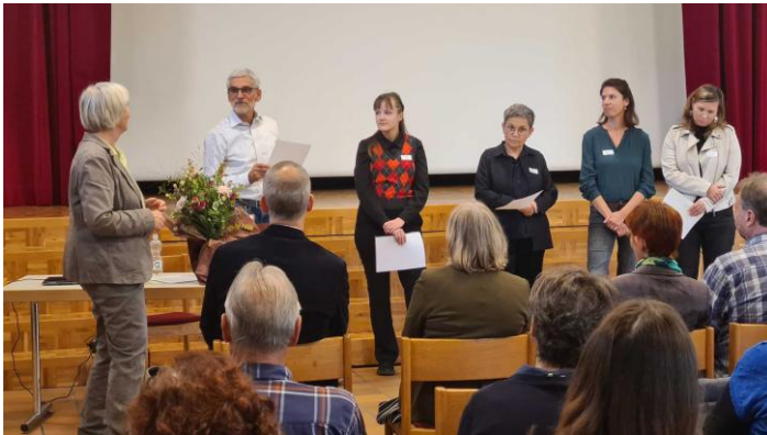
Übergabe der Vernetzungsurkunden unserer Partnerinstitutionen

Die VASK Bern blickt nicht ohne Stolz auf das 40-jährige Bestehen zurück. Wer weiss schon, dass die VASK Bern die Gründung aller Regionen veranlasst und mit je 1000.- CHF unterstützt hat? Oder dass die ersten Vorstände aktiv mitwirkten, wenn psychosoziale Angebote (der UPD) zu scheitern drohten? Ein Film gibt Einblick in die erste Zeit der VASK-Gründung .